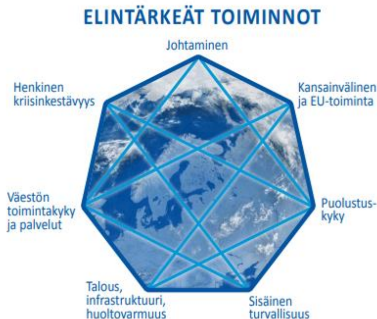
Kuva 2. Yhteiskunnan elintärkeät toiminnot; YTS 2017

Elintärkeät toiminnot ovat yhteiskunnan toimivuuden kannalta välttämättömiä, kaikissa tilanteissa ylläpidettäviä toimintokokonaisuuksia. Yhteiskunnan elintärkeät toiminnot ulottuvat useiden toimijoiden lakisääteisiin tehtäviin ja osin alueille, joille ei voida määritellä yhtä ainoaa vastuutahoa.